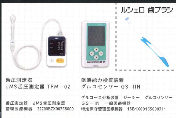
舌圧測定器 JMS舌圧測定器 TPM-02