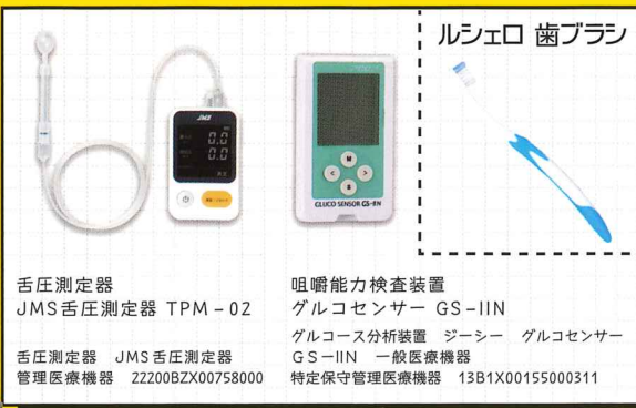
舌圧測定器 JMS舌圧測定器 TPM-02