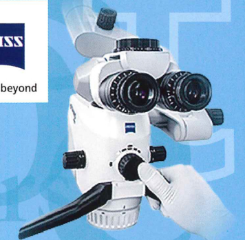
手術顕微鏡 EXTARO 300