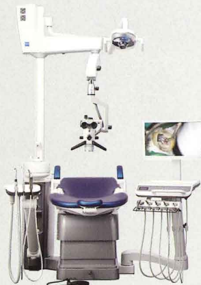
例：歯科用ユニット イオム アクア × 手術顕微鏡 EXTARO 300

ユニット周辺のフロアスペース確保に有用 ～ジーシー歯科用ユニット3機種に搭載可能～