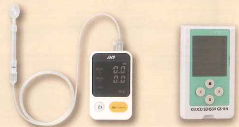
舌圧測定器 JMS舌圧測定器 TPM-02 管理医療機器 22200BZX00758000