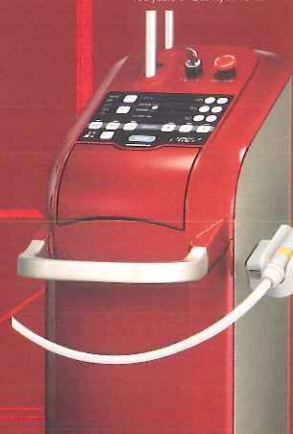
炭酸ガスレーザー ジーシー ガスレーザー Plus 高効率型 歯槽膿漏 特定保守管理器具承認 23000BZ×00030000