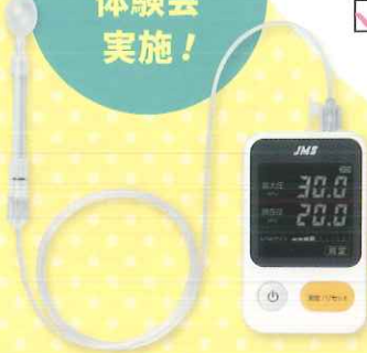
JMS舌圧測定器 TPM-02 管理医療機器 22200BZX00758000