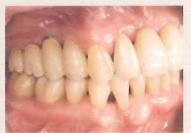
歯周病患者でのLOT適用例