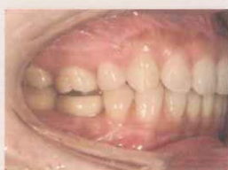
アンカースクリューを使用した上顎第一大臼歯の圧下症例