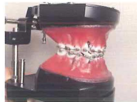
歯牙移動とメカニクスの理解