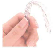
アライナー適用ケースを考える