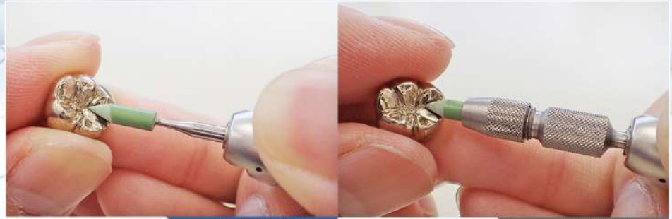
ピンポリッシャー