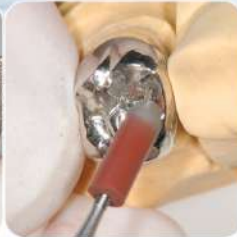
ピンポリッシャー