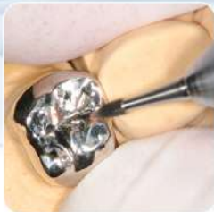
ハードメタルバー 咬合面の調整