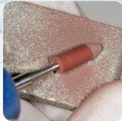
ポイントのドレッシング