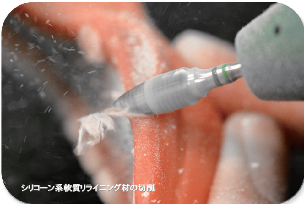
シリコン系軟質ライニング材の切削