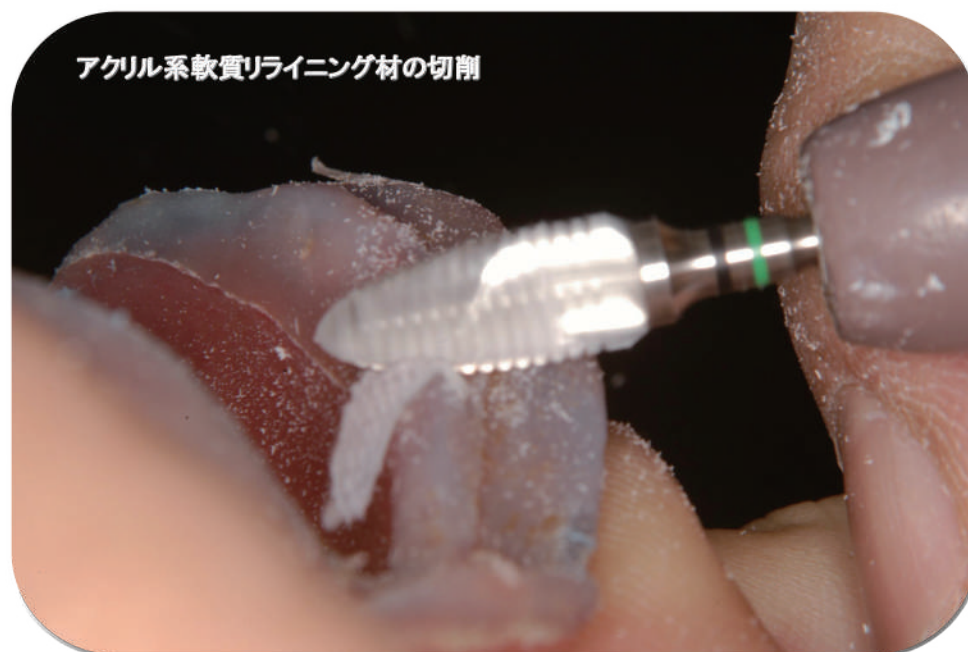
アクリル系軟質ライニング材の切削