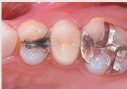
└4 松風ブロック HC A3-HT