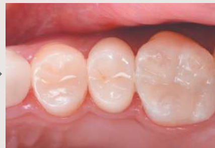
└6 松風ブロック HC スーパーハード A3-HT