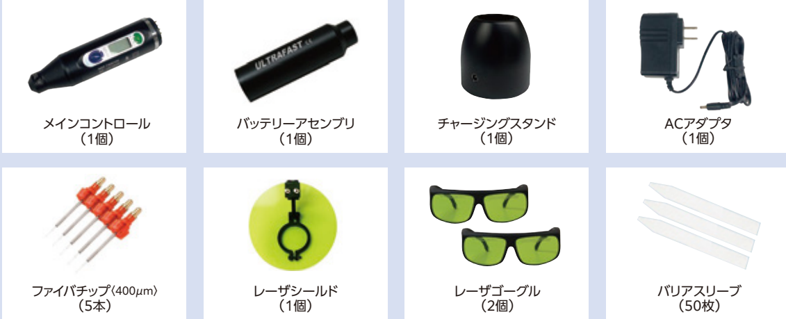
メインコントロール (1個)