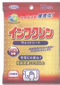
シートタイプ 20枚入り