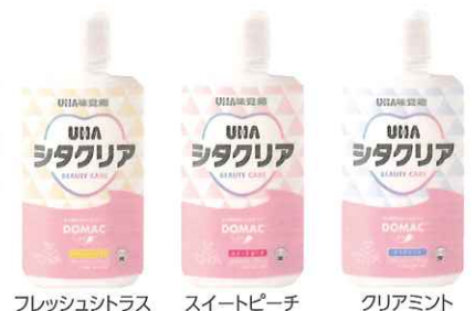
フレッシュシトラス スイートピーチ クリアミント