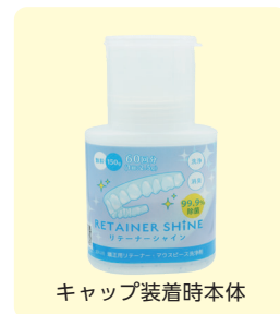
キャップ装着時本体