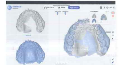
メトロントラック

スキャン画像をQRコード化し、スマートフォンで確認できる口腔内健康レポートをはじめ、患者の口腔変化を追跡するデータトラック、矯正シミュレーション機能など搭載。