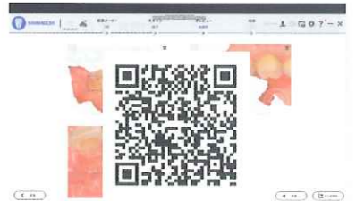
口腔内健康レポート