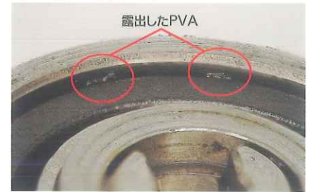
異物が固着した滅菌後のハンドピース

医療用包装資材分野のグローバルリーダーであるフランス ステリメッド社の医療用紙を使用しており、紙粉がほとんど出ません。