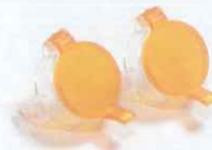
光源キャップ(オレンジ蓋付)