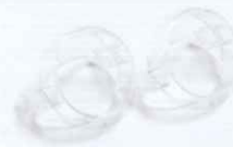
光源キャップ(クリア)