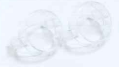
光源キャップ(クリア)