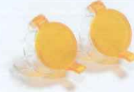
光源キャップ(オレンジ蓋付)