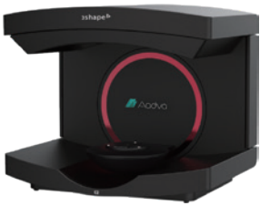
Aadva CAD/CAM システム Aadva スキャン E2