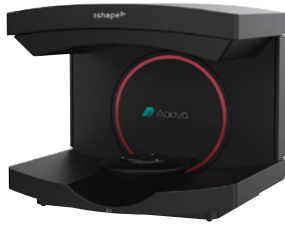
Aadva CAD/CAM システム Aadva スキャン E3