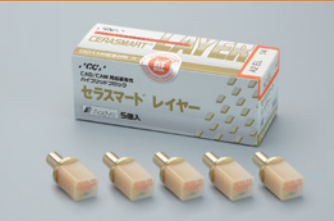
CAD/CAM用高審美性ハイブリッドブロック セラスマート レイヤー