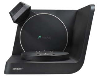
Aadva CAD/CAM システム Aadva スキャン F8