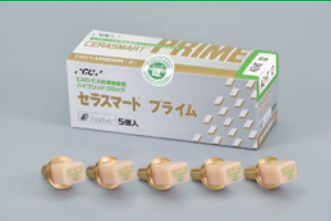
CAD/CAM用高靱性ハイブリッドブロック セラスマート プライム