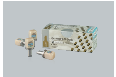
歯科切削加工用セラミックス イニシャル LiSi(リジ)ブロック