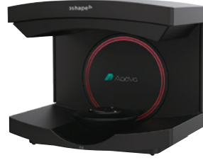
Aadva CAD/CAM システム Aadva スキャン E4