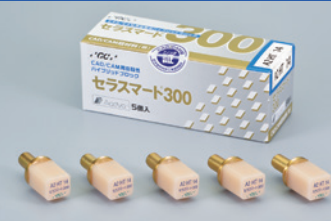
CAD/CAM用高靱性ハイブリッドブロック セラスマート 300