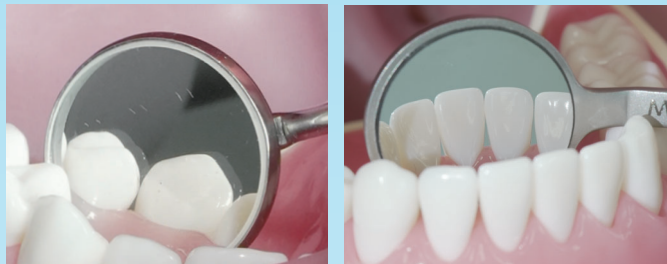
一般的なミラー ゴーストが発生

また、ミラー面も明るいため、照度の限られた口腔内での診療クオリティを落としません。