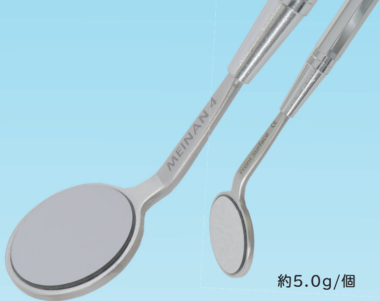
スリムネック両面ミラー そのままの映像で鏡視可能