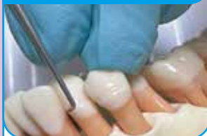
下顎前歯部唇側面

叢生の歯牙でも、この小さい器具なら操作しやすいです。先端まで両刃が付与されているので、効率的な除去ができます。