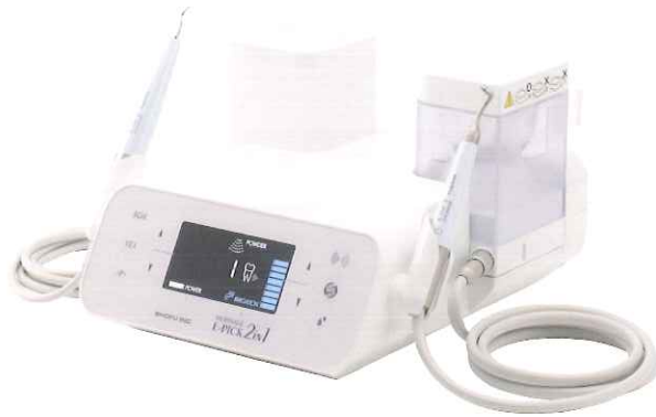
MERSAGE E-PICK 2in1