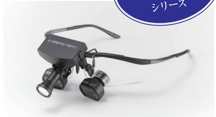
with Galilean Loupe UL Multi TTL ガリレアンルーペ UL TTL コードレスUVライトセット

一般名称: 双眼ルーペ 医療機器分類: 一般医療機器 届出番号: 13B2X10104100374