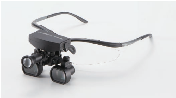
with Galilean Loupe UL Multi ガリレアンルーペ ULマルチ コードレスUVライトセット

■ Black (2.5倍/3.0倍) セット価格 80,000円 セットで10,000円お得! ■ Red (2.5倍/3.0倍)