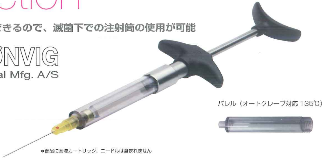
バレル (オートクレーブ対応 135°C)