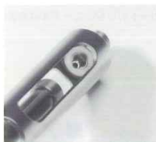
注射筒内側の突起