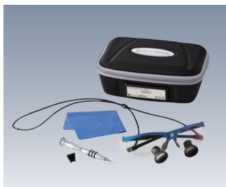
双眼ルーペ 一般医療機器 届出番号 26B1X00004000287

TTL 2.5 一式 【フレーム色】ブラック、ブルー、カーボン※、メルロー、パープル※ (※のついたカラーは受注発注品です。) 【瞳間距離】ナロー、レギュラー、ワイド※ 【作業距離】ショート(S)、レギュラー(R)、ロング(L)※ (※こちらは受注発注品です)