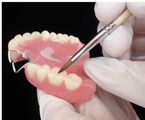
義歯のレジン築盛に適した直筆