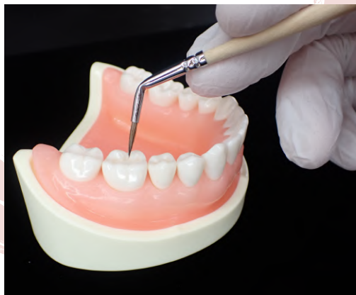
臼歯部の仮封に便利な曲筆