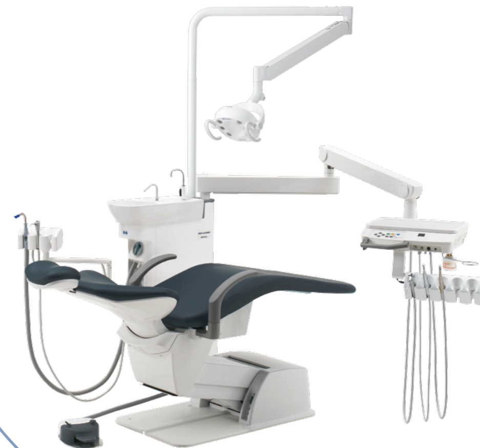
OVER ARM TYPE