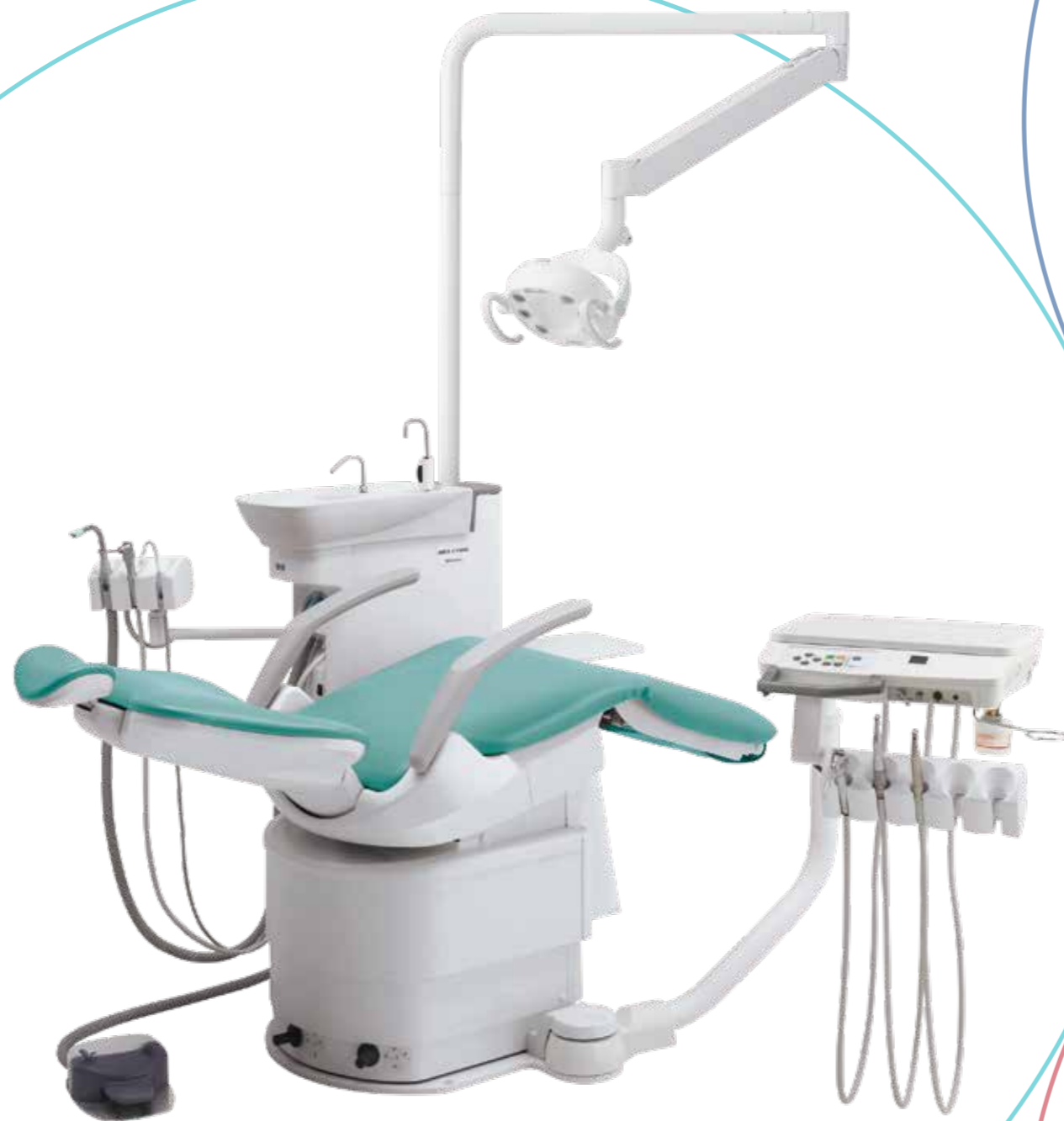
BASE MOUNT TYPE