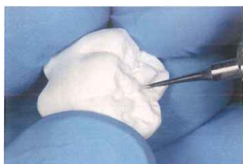
グループ調整あり