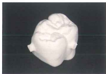
グループ調整なし

ジルグループポイントは、ジルコニアシンタリング前のグループ調整に用いるCAD/CAMのミリングバーでは再現できない微細な溝を作り出す事ができます。