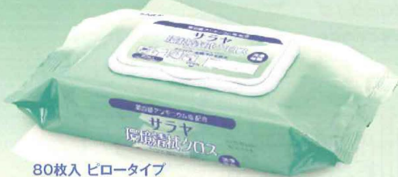
80枚入 ピロータイプ 1枚サイズ:150×230mm