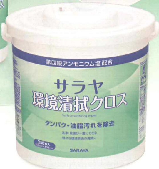
250枚入 容器 大判クロス 1枚サイズ:150×300mm