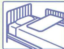
ベッド柵、オーバーテーブルに