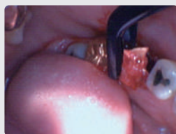
残存歯をラクセーター・ルートピッカーで把持