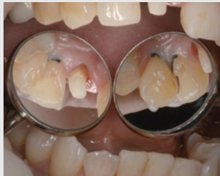
*クロスフィールド 鏡 取扱いのミラーによる比較

反射率の高いミラーは従来のミラーに比較すると特殊加工のために単価は高めに設定されている。しかし、臨床の現場で明るいミラーを用いることはそれらのコストの差を覆す程の恩恵をこうむることができることを考えれば、必ずしも割高とは言えない。是非『圧倒的な差』を体感していただきたい。