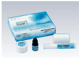
歯科用シーリング・コーティング材 ハイブリッドコートII セット (管理医療機器)