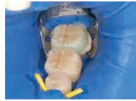
接着性レジンセメントでセットし、 余剰レジン を除去