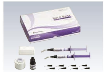
歯科裏層用高分子系材料 バルクベース セット (管理医療機器)