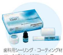
歯科用シーリング・コーティング材 ハイブリッドコートII