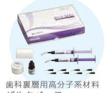
歯科裏層用高分子系材料 バルクベース