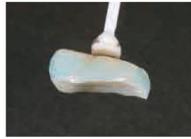
ウォッシュャブルセップ塗布