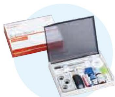
歯科接着用レジンセメント スーパーボンド