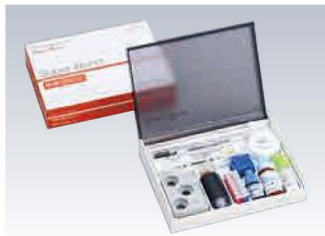
歯科接着用レジンセメント スーパーボンド 筆積混和SEセット (管理医療機器)