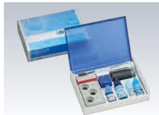
歯科充填用アクリル系レジン ボンドフィルSB セット (管理医療機器)