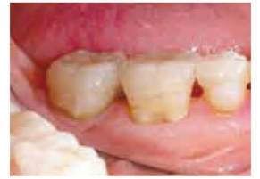
ウォッシュャブルセップを水洗で除去