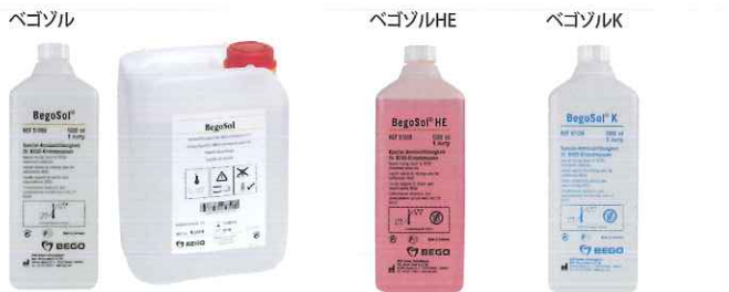
ウイロベスト、ウイロベストプラス、ウイロファイン、ウイロプラス用