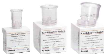
サイズ1 サイズ3 サイズ6