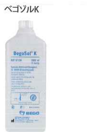
ウイロファイン、パルセオベストP プラス用

ベゴソルと精製水の混液比を変え、埋没材の膨張率をコントロールできます。ベゴソルの濃度が高いほど、埋没材の膨張は大きくなります。