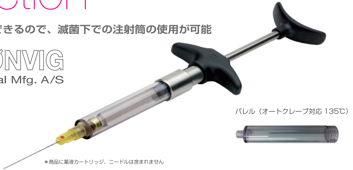
バレル (オートクレーブ対応 135°C)