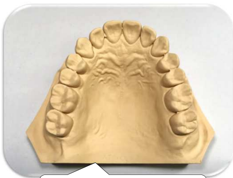
作業用模型の作製