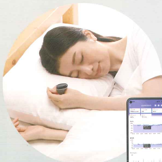
睡眠時無呼吸症のスクリーニング