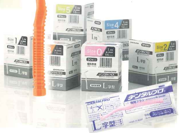
▲院内指導用として便利で清潔な個包装