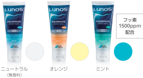
ニュートラル 〈無香料〉