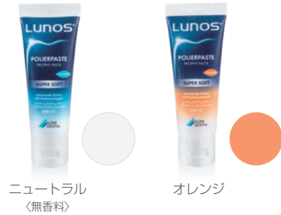
ニュートラル 〈無香料〉