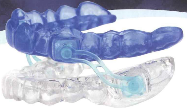
歯科咬合採得用材料 サイレンサー-SL