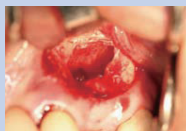
上顎洞粘膜挙上完了