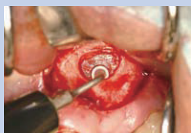
ST82 開窓辺縁の上顎洞粘膜剥離