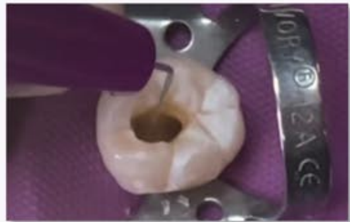
ベンタエンド ユニバーサルエンドハンドルとカルシファイルの併用による穿通は、術野を明視化し、時間短縮ができます。