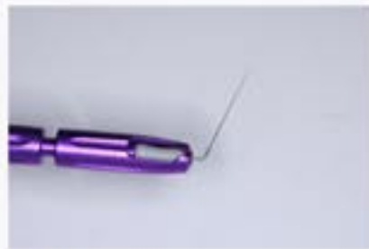
図2 Universal EndoHandle に Calcifile を装着した。ファイルは予め屈曲されている。