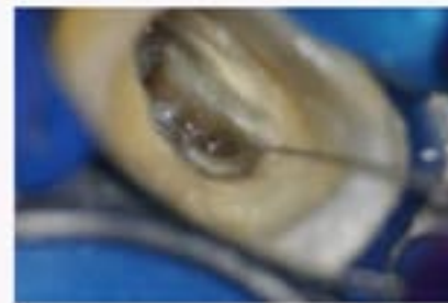
図3 術野も明瞭かつ、探索は容易、口蓋根は頬側へと合流していた。