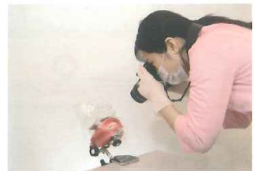
口腔内写真の撮影

●仕様および外観は、製品改良のため、予告なく変更することがありますので、予めご了承ください。 ●価格は、2016年2月現在のものです。標準価格に消費税は含まれておりません。