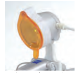
オレンジフィルタ

“EyeMag Smart” および “EyeMag PRO” に装着可能です。