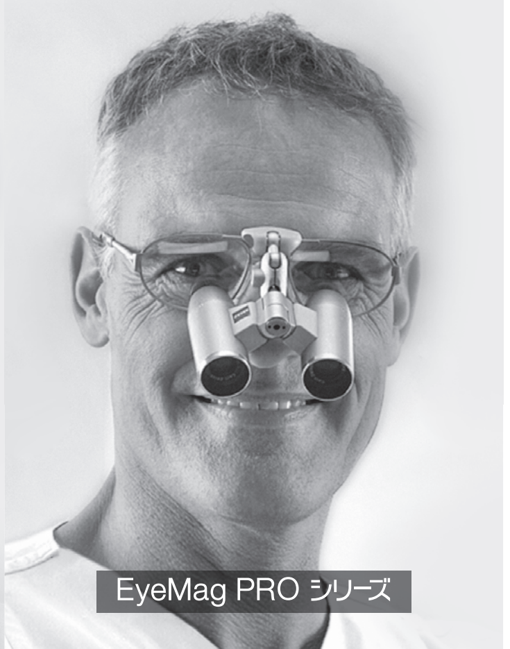
EyeMag PRO シリーズ