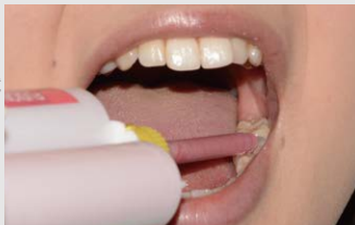
3) 印象採得と咬頭嵌合位での閉口保持