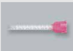
ミキシングチップⅡ S(ピンク) 包装●1画:60本 一般医療機器 23B2X00038000020