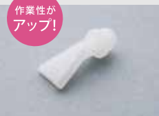
ミキシングチップフラットノズル 包装●1画:50個 一般医療機器 23B2X00038000039 ※ミキシングチップⅡS(ピンク)に装着できます。