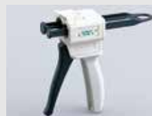
カートリッジディスペンサーⅡ 包装●1画:1個 一般医療機器 23B2X00038000019