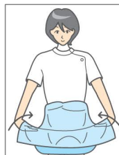
② エプロンの表側が内側になるようにして腰ひもの高さまで2つに折り込み、表側に触れないよう注意しながら両手でエプロンの裾をすくい上げる