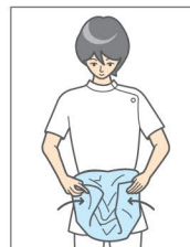
③ 表側が内側になるようまとめる