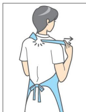
① 首の部分を持って体の前に強く引き、首ひもを切る