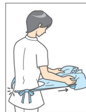
④ 体の前方へ強く引いて腰ひもを切り、エプロンの表側に触れないよう注意しながら、廃棄する