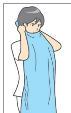
① 首の部分を持ってかぶる