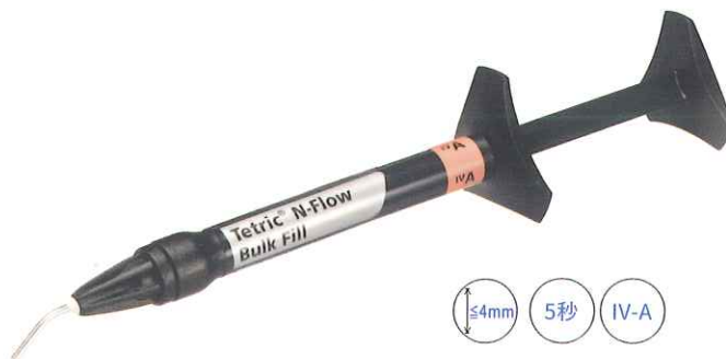
テトリック N-フロー バルクフィル