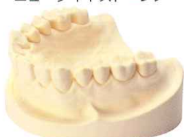
テンドーオレンジ