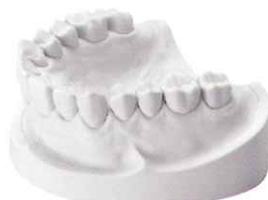
ナチュラルグレイ