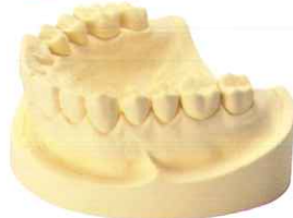
パステルオレンジ