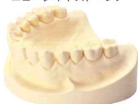
テンドーオレンジ